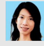
レジオン・コンサバティブ(株)1級建築士事務所代表。日本フリーランスインテリアコーディネーター協会理事。『素敵な部屋をつくるインテリアの基本』(西東社)の監修など、本や雑誌、TV等の仕事でも活躍している。

■部屋のレイアウト 集中力を上げるためには窓の正面ではなく、壁に向けて置くのが良いでしょう。机の横に窓がある配置が一番良いかもしれません。 ■部屋の色 カーテンやベッドカバーなどの色は、単色でパリッとした印象にするのが気が散らないと思えます。鮮やかな色よりも、白・グリーン・イエロー・ブルーなどを単色で使うのがおすすめです。 ■照明は蛍光灯を 気分を高揚させてやる気を出すには、白熱灯の黄色い光より、蛍光灯の白い光のほうが適しています。蛍光灯は影がでないので、オフィスなどではすべて蛍光灯が使われています。チラツキの少ないインバータ照明が良いでしょう。手元が明るいほうが集中力は高まるので、補助照明として勉強用の電卓スタンドを使うのがおすすめです。